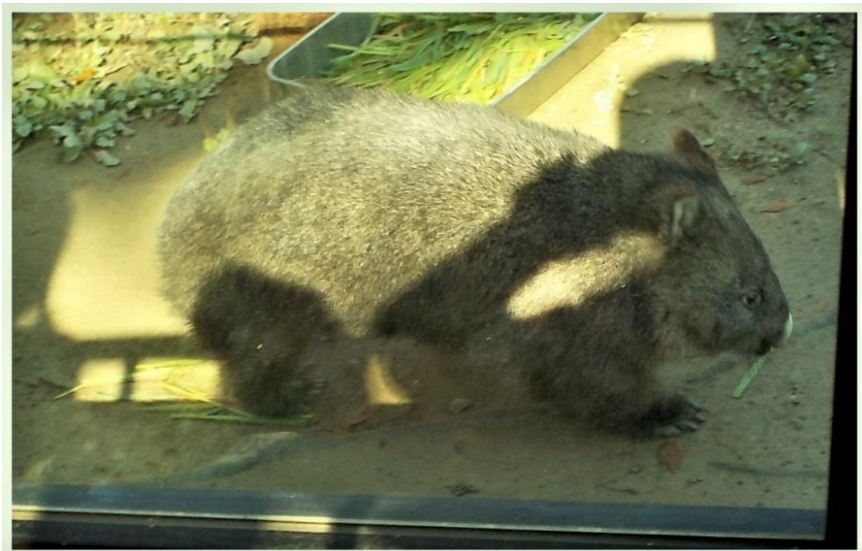
池田市のシンボル 「ウオンバット」