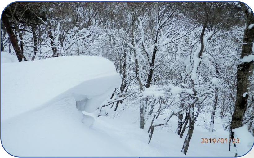
大きく張り出した雪庇