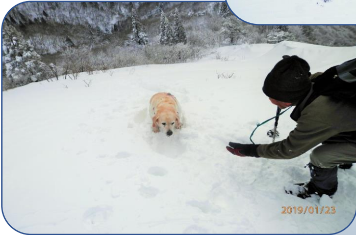
ワンちゃん頑張れ