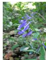
アキショウジ（シソ科）