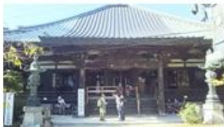
施福寺（西国三十三所観音霊場第四番札所）